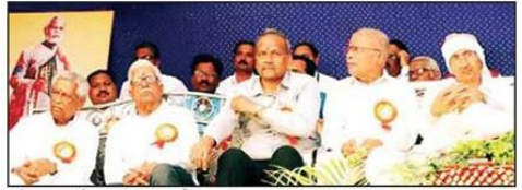
भूमिपूजन कार्यक्रमात मंचावर उपस्थित मान्यवर