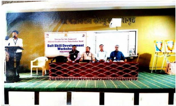
C.S. Scanned with CamScanner M.F.M. Warud Soft Skill Development Workshop Dt. 16.01.2020 To 22.01.2020