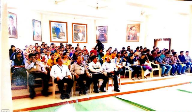
C.S. M.F.M. Warud Soft Skill Development Workshop Dt. 16.01.2020 To 22.01.2020