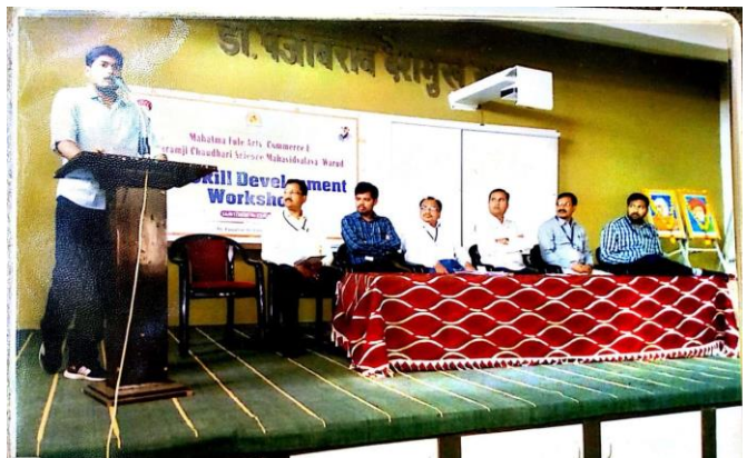
C.S. Scanned with CamScanner M.F.M. Warud Soft Skill Development Workshop Dt. 16.01.2020 To 22.01.2020