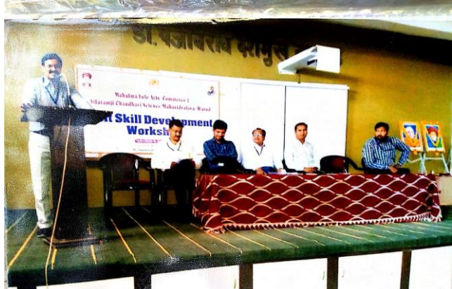
C.S. M.F.M. Warud Soft Skill Development Workshop Dt. 16.01.2020 To 22.01.2020