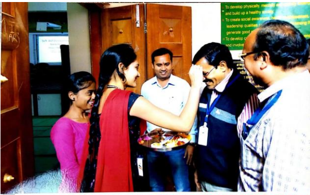
C.S. Scanned with CamScanner Soft Skill Development Workshop Dt. 16.01.2020 To 22.01.20